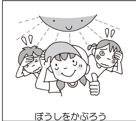
ぼうしをかぶろう