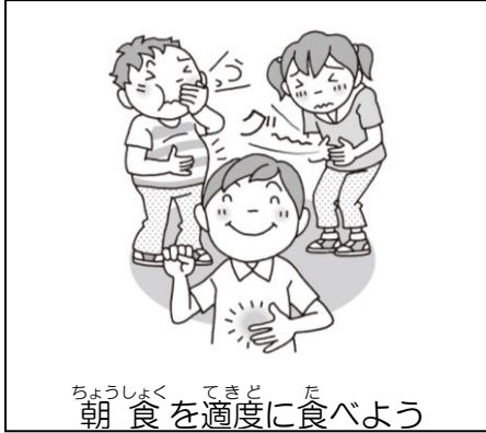
朝食を適度に食べよう

4月中でも夏を思わせる気温の日もあるこの頃、5月26日(土)の運動会に向けた練習がはじまります。例年、大きなけがや体調不良者を出さず無事に運動会が終わっていることは、ご家庭でも確実な健康観察を行っていただいている証拠です。今年もみんなの練習成果が発揮できる運動会になるといいですね。