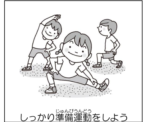
しっかり準備運動をしよう