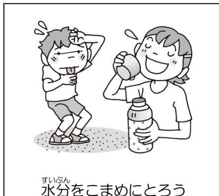
水分をこまめにとろう