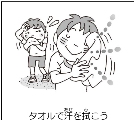
タオルで汗を拭こう