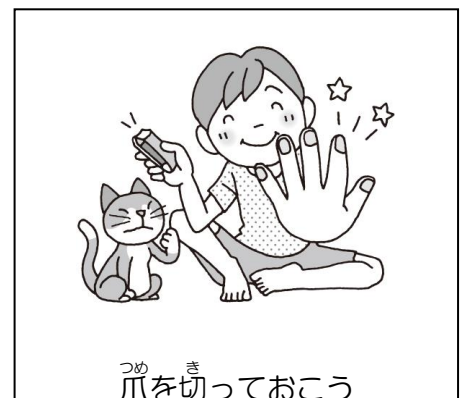
つまをきっておこう